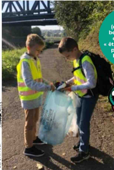
-EdAN-A.C. Le Journal des Enfants

Be WaPP » (du verbe « to be » en anglais, qui veut dire « être » et « WaPP » pour Wallonie Plus Propre),