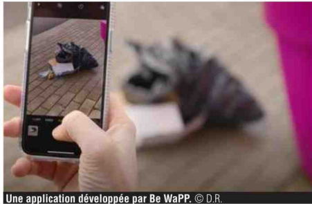
Une application développée par Be WaPP.